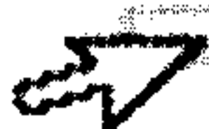
María Isabel Lozano Profesional Universitaria Elaboró